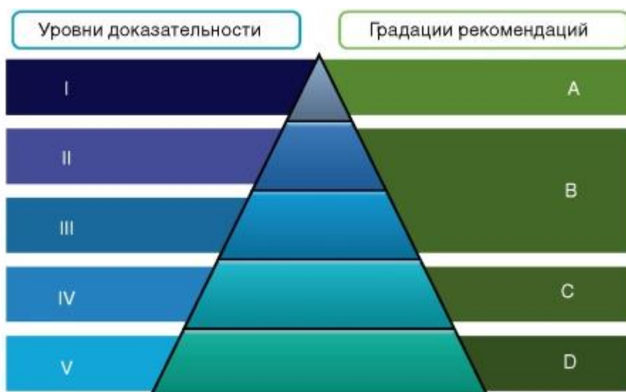
Рисунок 2. Соотношение уровней доказательности и градаций рекомендаций (Oxford Centre for Evidence-Based Medicine).

А на рисунке 2 - соотношение уровней доказательности и градаций рекомендаций.