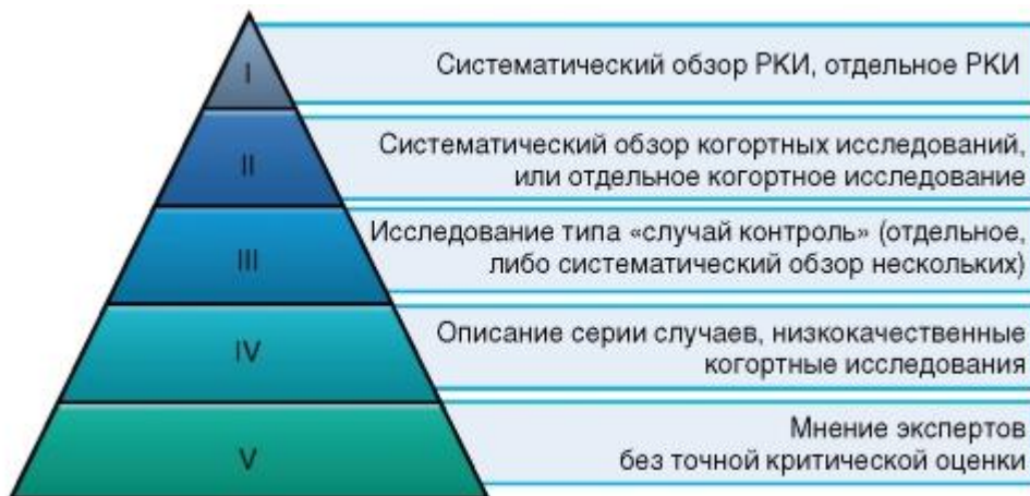
Рисунок 1. Уровни доказательности

Шкала уровней доказательности, разработанная Оксфордским Центром доказательной медицины (Oxford Centre for Evidence-Based Medicine).